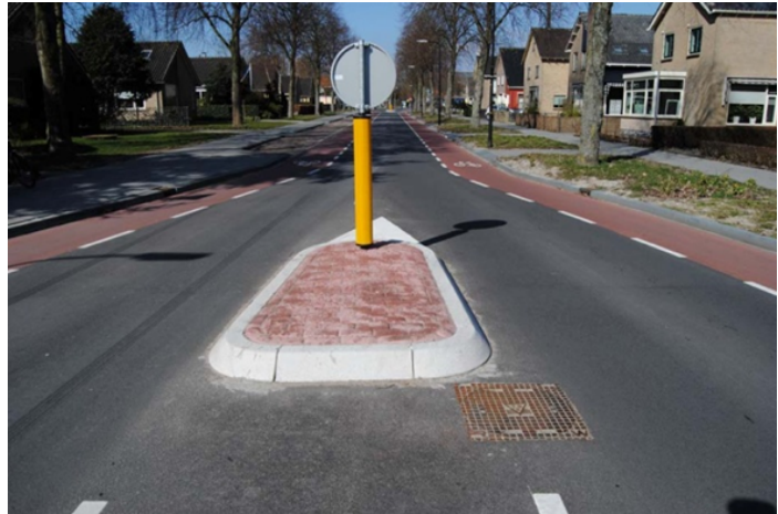
Figuur 1 Putdeksel

Je stelde, dat de middengeleider bij de Oranjelaan niet breder kon vanwege de put die daar ligt. Deze ligt niet in de weg (figuur 1). We zouden dan ook graag zien, dat de wegvakken hier ook de gewenste breedte van 155 cm krijgen. Gezien de (lange) remsporen is dat ook zeer noodzakelijk.