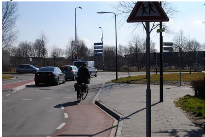
Figuur 2 Uitbuigen fietsstrook

In plaats van de knik naar links zijn wij er nog steeds voorstander van, dat de fietsstrook geleidelijk naar rechts via een deel van het huidige trottoir richting Oranjelaan worden geleid (zie figuur 3).