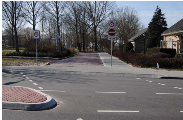
Figuur 4 Borden 30 km zone

In ons gesprek heb ik de steile opritten van de Julianalaan genoemd. Onze metingen tonen een hoogteverschil van 11 cm op 60 cm (1:5). Dat is het dubbele van de CROW-norm, die een gehandicaptenafrit aangeeft (1:10). Gehandicapten moeten het via deze afritten doen, wegens het ontbreken van deze specifieke voorzieningen over de gehele Julianalaan.