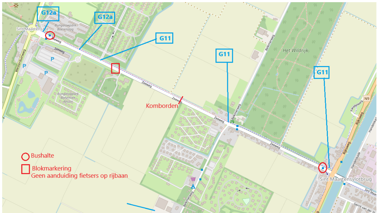
Figuur 1 Huidige bebording en belijning

Vanaf de N9 worden de bromfietsen in de huidige situatie ten onrechte niet naar de rijbaan gestuurd. Ze mogen immers niet op een verplicht fietspad (G11).