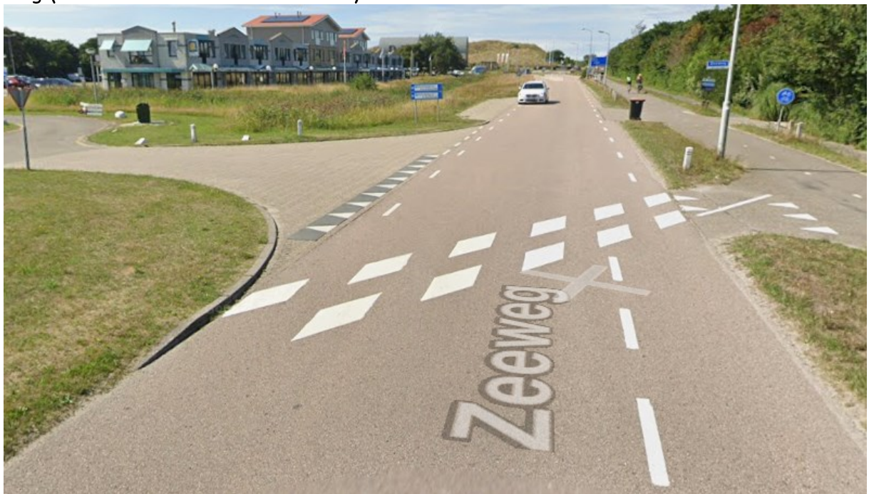
Figuur 2 Huidige markering

Vanaf de rotonde Sint Maartenszee rijden (brom-)fietsers op het (brom-)fietspad. Ter hoogte van de parkeerplaats van Strandslag 14 is er een (foute) blokmartering op de weg (als dit bedoeld is als oversteek).