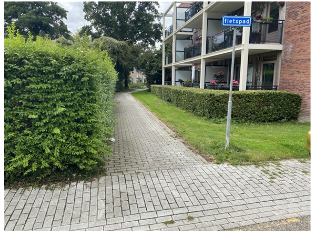
Dezelfde bestrating voor voetpad (hiernaast) én dit fietspad schept verwarring voor voorrang.