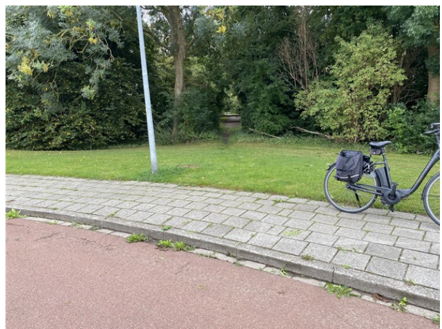
Doorgang realiseren vanaf ovonde naar Trambaan.