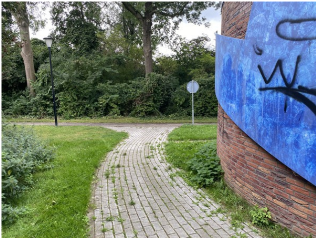
Bord G13 ontbreekt op voetpad