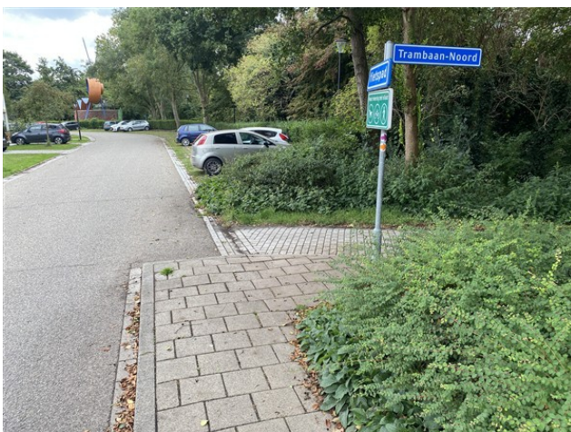
Inrit verbeteren door ronde bocht. Óf deze inrit dicht en vervangen door voorstel hiernaast.