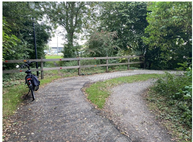
Verharding verbeteren en doorgang rechtdoor realiseren naar ovonde.